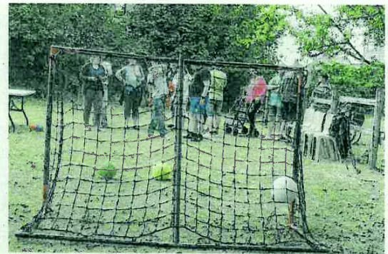
L'épreuve tant redoutée des tirs au but. Les buteurs étaient de sortie.