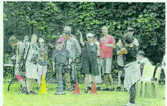
Les équipes étaient réunies par groupes. Pas un membre ne manquait à l'appel des officiels !