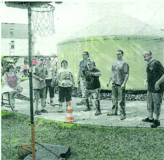
L'épreuve des lancers-francs. L'entraînement doit être assidu car le taux de réussite avoisinait les 80 %.