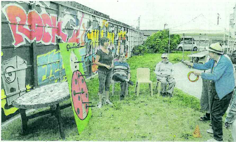
L'épreuve des cerceaux. En arrière plan, le superbe graff qui donne beaucoup de charme à cette enceinte sportive improvisée.

Chaque mercredi, dans un centre de l'APEI à chaque fois différent, des compétitions sportives mettent aux prises les équipes de chaque unité. Ça fonctionne au-delà de toutes les espérances.