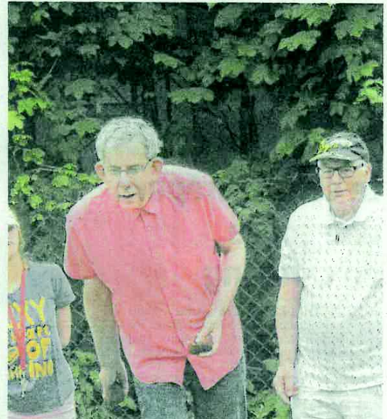
Non, ce n'est pas le roi de la pétanque provençale. L'épreuve du lancer de poids demandait une concentration toute méditerranéenne !